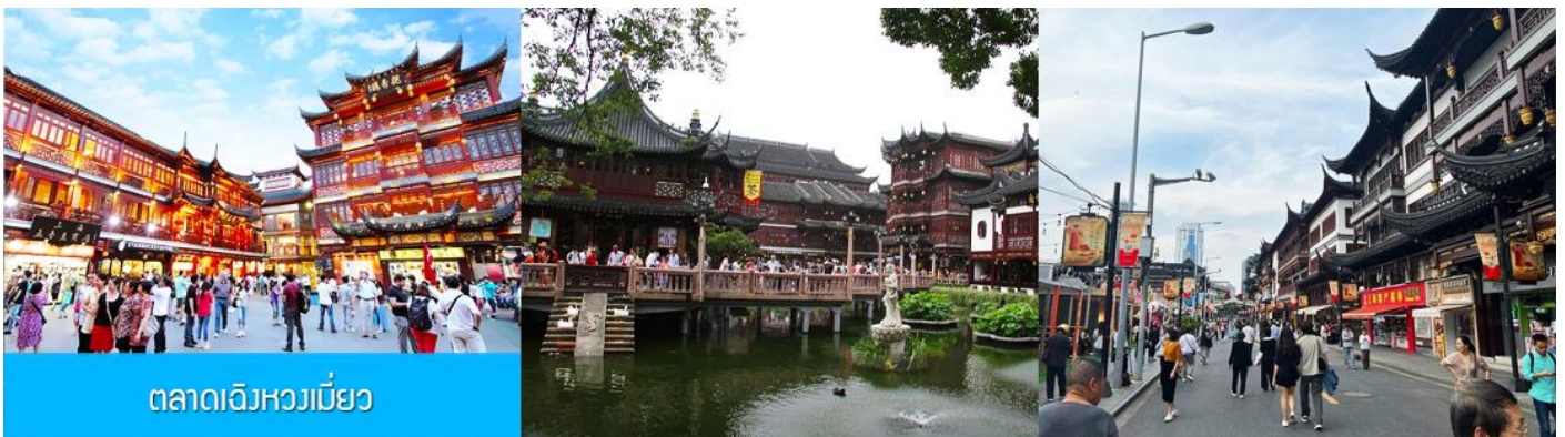
ตลาดเจิงหวงเมี่ยว

เช้า รับประทานอาหารเช้า ณ ห้องอาหารของโรงแรม (6)