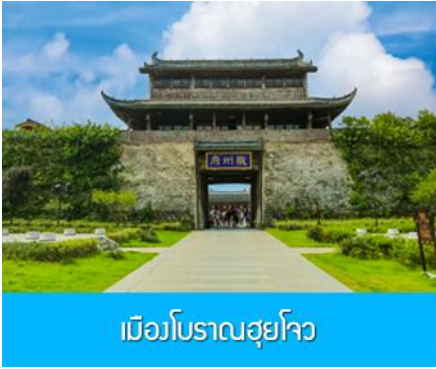
เมืองโบราณฮุยโจว