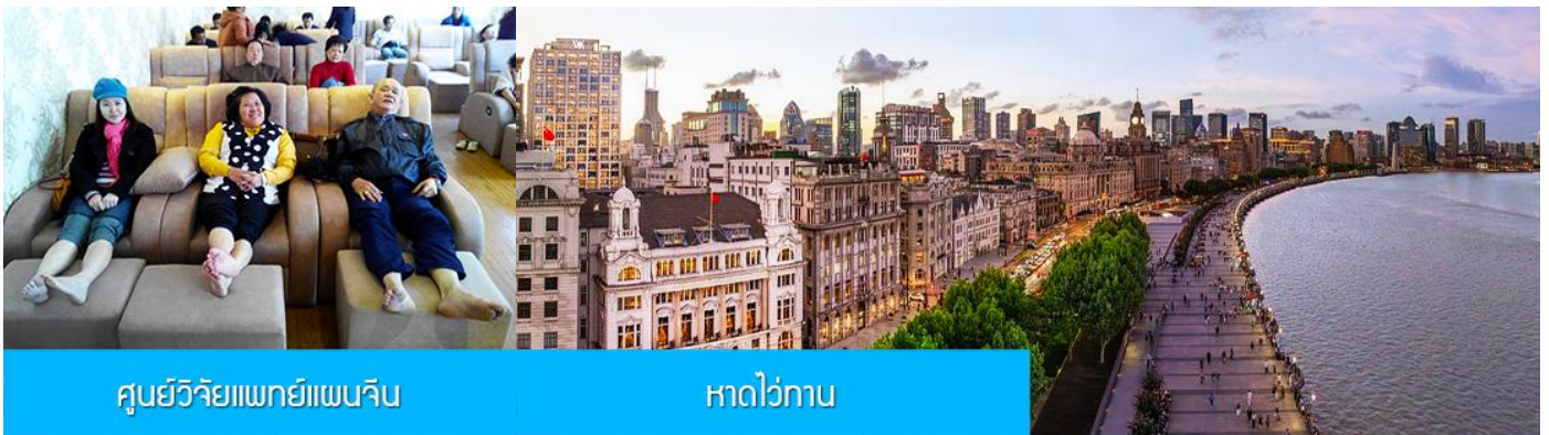
ศูนย์วิจัยแพทยแผนจีน