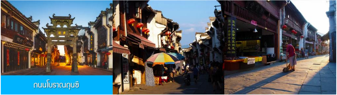
ถนนโบราณคุนซี

นำท่านเที่ยวชม ถนนโบราณคุนซี 屯溪老街 ถนนที่เป็นย่านการค้าโบราณในยุคราชวงศ์ซ่งได้แก่กว่า 700 ปี ถนนมีความยาวราว 1272 เมตร สองฝั่งถนนมีอาคารบ้านเรือนโบราณสไตล์หุยโจวที่สร้างในยุคปลายราชวงศ์หมิงและราชวงศ์ชิงที่ถูกอนุรักษ์ไว้เป็นอย่างดี ปัจจุบันยังมีห้างร้าน โบราณ อาทิ ร้านขายโบราณวัตถุ ร้านขายหยก ร้านขายภาพเขียนและอักษรพู่กันโบราณ ร้านอาหารพื้นเมือง ร้านขายของที่ระลึก ฯลฯ นอกจากนี้ร้านค้าและอาคารบ้านเรือน โบราณที่นี้ยังเป็นแหล่งรวมของนักท่องเที่ยวที่มาชิมอาหารพื้นเมือง เดินช้อปปิ้งและถ่ายภาพ เช็किन