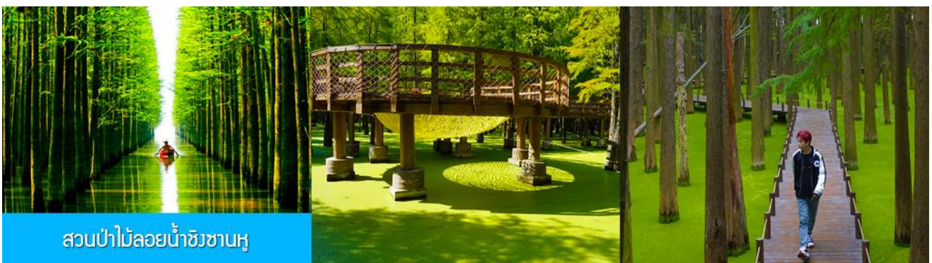
สวนป่าไม้ลอยน้ำชิงซานหู

หลังอาหารเช้าท่านเดินทางโดยรถบัสสู่เมืองหลิงอัน 临安市 (ระยะทาง 175 กม. ใช้เวลาเดินทางราว 2 ชั่วโมงเศษ)