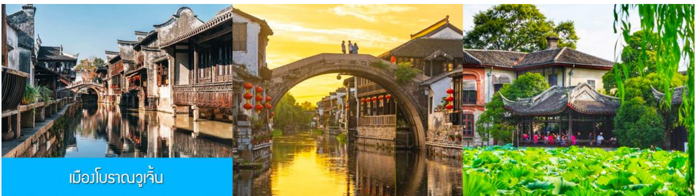
เมืองโบราณวูเจิ้น

เที่ยง รับประทานอาหารกลางวัน ณ ภัตตาคาร (7)