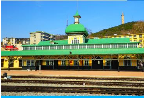
สถานีรถไฟลี่ซุ่น