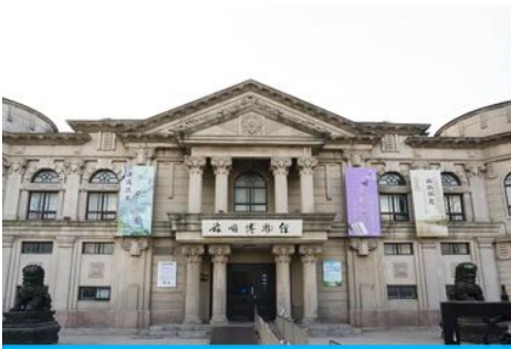
พิพิธภัณฑ์ประวัติศาสตร์ลี่ซุ่น

นำท่านเที่ยวชมและเก็บภาพ ณ สถานีรถไฟลี่ซุ่น 旅顺火车站 เป็นสถานีปลายทางของเส้นทางรถไฟสาขาเส้นหยาง - ต้าเหลียน สร้างขึ้นในปีค.ศ. 1903 ออกแบบโดยสถาปนิกชาวรัสเซีย เป็นอาคารอิฐก่อปูนผสมโครงสร้างไม้ตามสถาปัตยกรรมรัสเซีย.