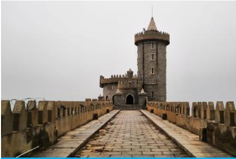
คาเฟ่อีสดง