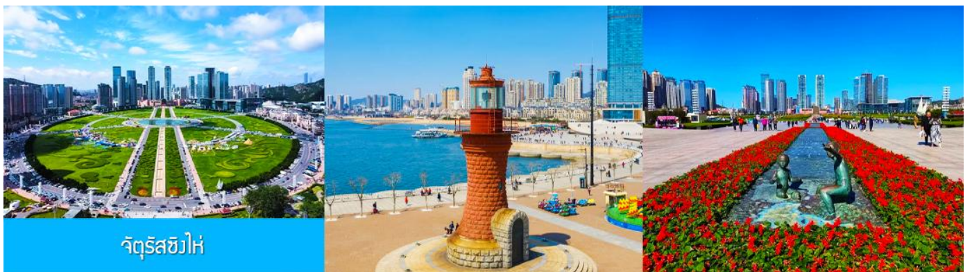
จัตุรัสซีไห่

จากนั้นนำท่านเที่ยวชมและเก็บภาพ ณ พิพิธภัณฑ์ประวัติศาสตร์หลี่ซุ่น 旅顺博物馆 เป็นอาคารพิพิธภัณฑ์เก่าแก่อายุกว่าร้อยปีแห่งแรกที่สร้างขึ้นทางภาคตะวันออกเฉียงเหนือของจีน อาคารพิพิธภัณฑ์มีความโดดเด่นด้วยสถาปัตยกรรมแบบกรีกโรมันยุคเรเนซองส์ ผสมผสานสถาปัตยกรรมแบบตะวันตก ภายในมีการจัดแสดงโบราณวัตถุกว่า 60,000 ชิ้น ท่านสามารถเก็บภาพที่ระลึกด้านหน้าอาคารพิพิธภัณฑ์ และสามารถเข้าชมโบราณวัตถุภายในพิพิธภัณฑ์ได้ตามอัธยาศัย (พิพิธภัณฑ์ปิดทุกวันจันทร์)..