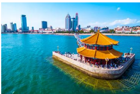
สะพานเทียนเจียว

เช้า รับประทานอาหารเช้า ณ ห้องอาหารของโรงแรม (1)