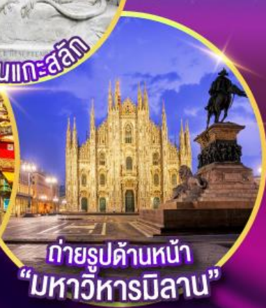
ถ่ายรูปด้านหน้า "มหาวิหารมิลาน"