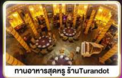
กานอาหารสุดหรู ร้านTurandot