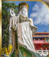
เจ้าแม่กวนอิม ริพลีสเบย์