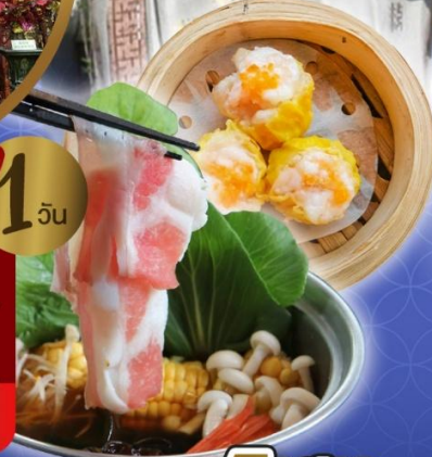
เจ้าแม่กวนอิม ริพลีสเบย์