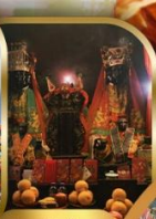
วัดบ้านใหม่