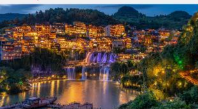
หมู่บ้านโบราณฝูหรงเจิน