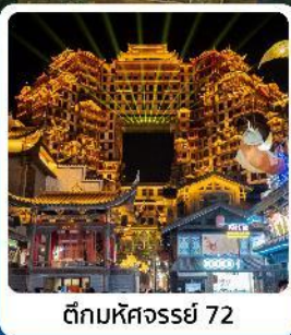
ตึกหอคจรรย 72