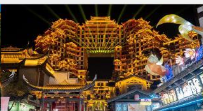
ตีทมห้ศจสรย์ 72