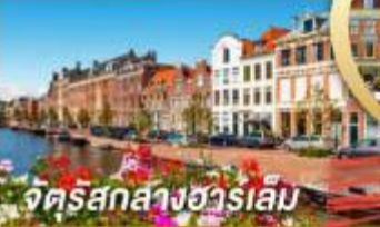
จัตุรัสกลางฮาร์เล็ม