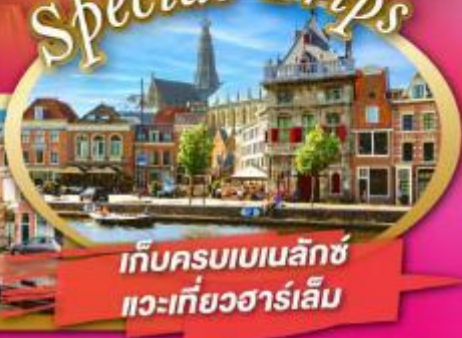
เก็บครบเบเนลักซ์ แวะเที่ยวฮาร์เล็ม