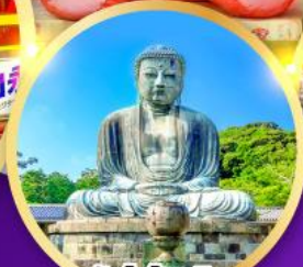
วัดโคโคคุอิน