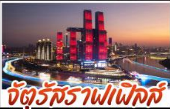
จัตุรัสราฟาเอลิส