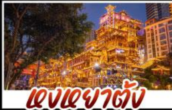
แสงเซาตัน

สัมผัสประสบการณ์เที่ยวจีนแบบเต็มอิ่ม ทั้งความล้ำสมัยของมหานครฉงชิ่ง และความงามตามธรรมชาติของธรรมชาติที่อู่หลง ทุกการเดินทางเต็มไปด้วยความสะดวกสบายและคุ้มค่าที่สุด!