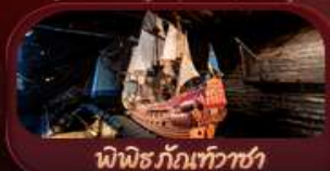
พิพิธภัณฑ์เก่า