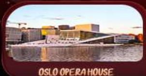
OSLO OPERA HOUSE

รหัสโปรแกรม : SEK156 9วัน 6คืน ✈️ เที่ยวบินไทย-ออกโตปเนฮกน