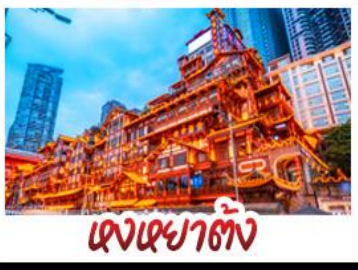
แดงหยาดัง