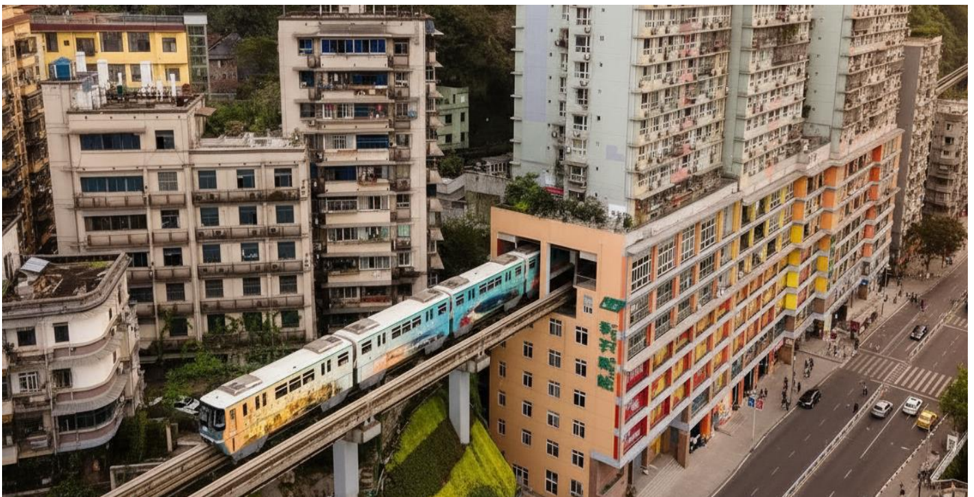
บ่าย นำท่านแวะเช็คอิน สถานีรถไฟฟ้าทะลุตึก (Liziba Station) ชมภาพรถไฟฟ้าวิ่งทะลุกลางอาคารพักอาศัยอย่างกลมกลืน ขบวนแล้วขบวนเล่าที่แล่นผ่านไปอย่างแม่นยำไร้เสียงรบกวน กลายเป็นสัญลักษณ์ระดับโลกของความอัจฉริยะทางวิศวกรรมและการออกแบบเมือง ที่สะท้อนแนวคิด “เมืองซ้อนเมือง” ของ