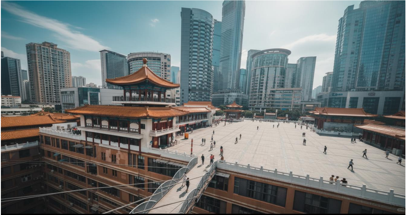
กลางวัน รับประทานอาหารกลางวัน ณ ภัตตาคาร (เมื่อที่ 2)

แต่ ณ ที่แห่งนี้ ชื่อนั้นได้ถูกนำมาใช้กับสถาปัตยกรรมที่ทำหายทุกกฎเกณฑ์ของแรงโน้มถ่วงและจินตนาการ เมื่อก้าวเท้าเข้าไปใน "หอขุยซิง" คุณอาจพบว่าตัวเองกำลังยืนอยู่บนสะพานที่เชื่อมต่อระหว่างสองยอดตึกสูงเสียดฟ้า! ที่นี่คือจุดที่คำว่า "ชั้น 1" กลายเป็นเพียงแนวคิดที่จับต้องไม่ได้ เพราะทางเข้าของคุณอาจอยู่ที่ชั้น 10 ของตึกหนึ่ง แต่กลับเชื่อมไปสู่ชั้น 1 ของอีกตึกหนึ่งได้อย่างน่าอัศจรรย์