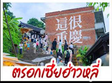
ตรอกเซี่ยฮ่าวหลี่