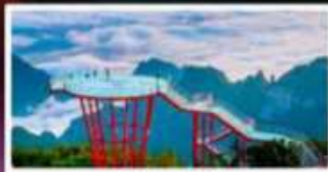
กุเวา 7 ดาว