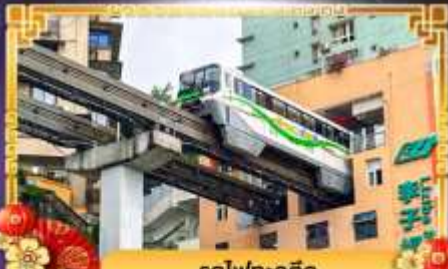
รถไฟฟ้า-ลัด