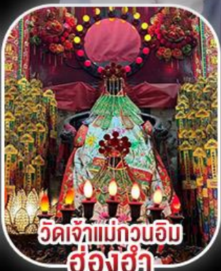
วัดเจ้าแม่กวนอิม ฮ่องฮำ