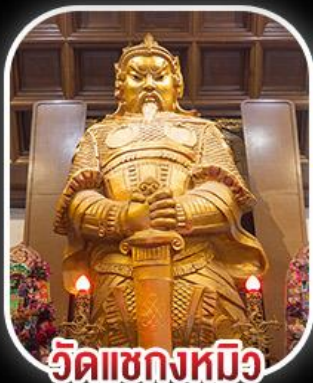
วัดเขกหงหมีว

สวนสนุก CHIMELONG SPACESHIP PARK เจ้าแม่กวนอิมร์พลิสเบย์ - เจ้าแม่กวนอิมฮ่องฮำ วัดเขกหงหมีว - พระใหญ่องปิง+กระเช้า เมนูสุดพิเศษ!! เป้าอ้อ+ไวน์แดง , ห่านย่าง