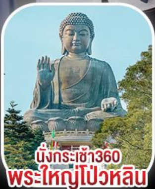
นั่งกระเช้า360 พระใหญ่โป้วหลิน