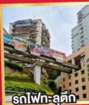
รถไฟทะลุศึก