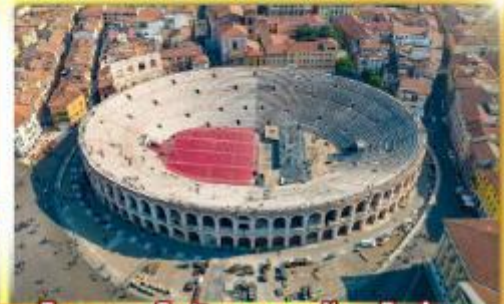
โรงละครโรมันกลางจัหวโรม่า