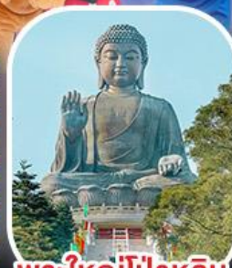
พระใหญ่โป้วหลิน