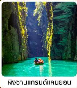
ผิงชานแกรนด์แคนยอน