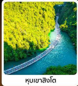
คุบเขาสิงโต

ไฮไลท์! ปืนตรงลงเอ็นซีอ ที่ยวเอ็นซีอเน้นๆจัดทีมทั่วเมือง คุบเขาสิงโต ผิงชานแกรนด์แคนยอน อุกยานจีนลี่ชาน