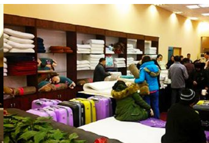
ศูนย์จำหน่ายผลิตภัณฑ์ยาพารา