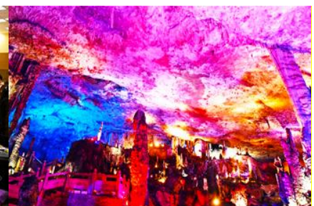
ถ้ำเก้าสวรรค์จิวเกียนตัง