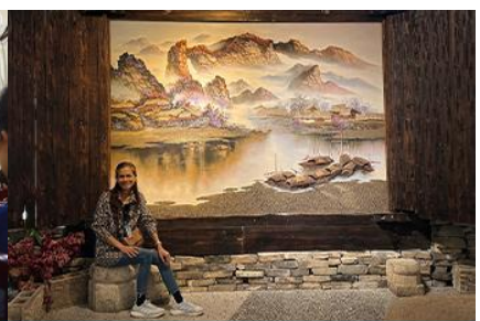
พิพิธภัณฑ์ภาพถ่ายเขียนหินทราย

วันที่สี่ เมืองจางเจียเจีย- ศูนย์ผลิตภัณฑ์หยก –ร้านใบชา – พิพิธภัณฑ์ภาพถ่ายเขียนหินทราย-ไกด์นำเสนอโปรแกรมเสริม สะพานกระจกแกรนด์แคนยอน- เมืองหยี่ซาง