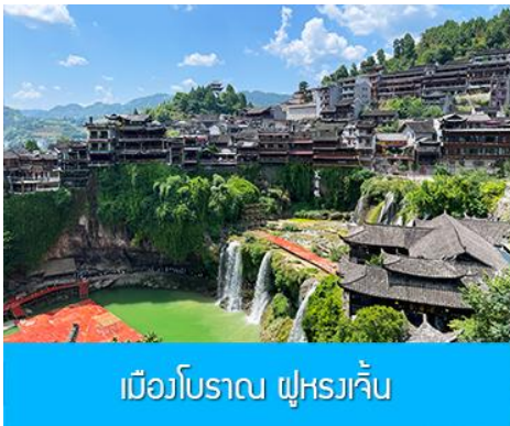
เมืองโบราณ ฝูหรงเจิน

จากนั้นนำท่านเดินทางสู่เมืองฝูหรงเจิน นำท่านเที่ยวชม เมืองโบราณ ฝูหรงเจิน 芙蓉古镇 เมืองโบราณเก่าแก่ขึ้นชื่อของมณฑลหูหนานที่โด่งดังจาก ภาพยนตร์เรื่อง ฝูหรงเจิน เป็นสถานที่ท่องเที่ยวระดับ 4A ที่ได้รับความนิยมจากนักท่องเที่ยวคู่กับเมืองโบราณฟงหวง เป็นสถานที่หลักในการถ่ายทำภาพยนตร์เรื่อง ฝูหรงเจิน ทำให้สถานที่แห่งนี้ยังได้รับความนิยมจากนักท่องเที่ยว จุดไฮไลท์ของเมืองโบราณแห่งนี้ นอกจากบ้านเรือนโบราณสวยเก๋ที่เป็นเอกลักษณ์เฉพาะของมณฑลหูหนาน ที่นี่ยังมีน้ำตกขนาดใหญ่ที่สวยงามกลางเมืองที่เป็นจุดเช็คอิน