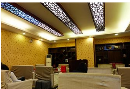
ศูนย์แพทยแผนจีน

อัตราค่าบริการสำหรับโปรแกรมเสริมการแสดงชุด The love Story of Wooden man and Fairy Fox ท่านละ 400 หยวน (หรือประมาณ 2000.-บาทขึ้นอยู่กับอัตราแลกเปลี่ยน) ระยะเวลาที่ใช้ในการเที่ยวชมการแสดง ประมาณ 3 ชั่วโมง รวมเวลาเดินทางไปกลับค่าบริการรวม ค่าบัตรเข้าชม ค่ารถรับ ส่ง และค่าน้ำเที่ยวของไกด์ท้องถิ่น