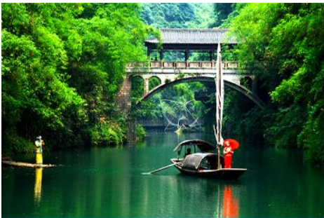
หมู่บ้านชาวลี

พักที่ YICHANG HUIHAO HOTEL โรงแรมระดับ 4 ดาวหรือเทียบเท่าในเมืองหยี่ชาง