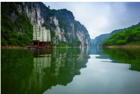
ล่องเรือ เหมาหยียนเหอ