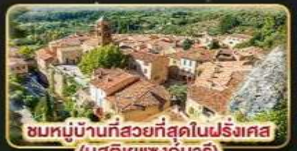
ชมหมู่บ้านที่สวยงามที่สุดในฝรั่งเศส (มูสติเยแซงก์มาร์)