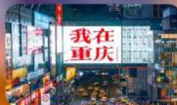
ถนนกวนอิมเฉียว