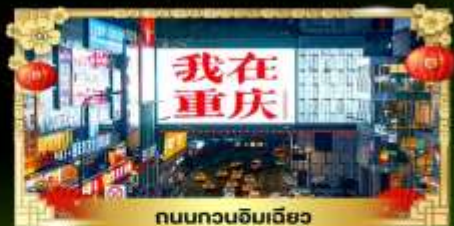
ถนนทวงฉิมเฉียว