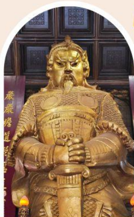
วัดแซกง ขอพรโชคลาง การเงิน และธุรกิจ