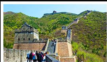
กำแพงเมืองจีนด่านจวิยงกวน