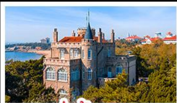
ป่าต่ากวน

พระราชวังฤดูร้อน - วิวเมืองซิงเต่า รถไฟความเร็วสูง - ภูเขาเหลาซาน กำแพงเมืองจีนด่านจวิยงกวน - ป่าต่ากวน พักโรงแรมระดับ 4 ดาว - ไม่ลงร้านช้อปปิ้ง มือพิเศษ เปิดปักกิ่ง , หม้อไฟซีฟู้ด