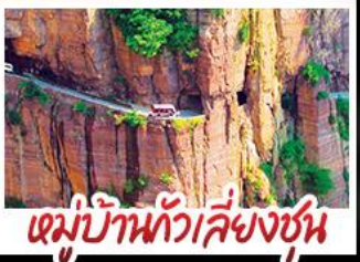
หมู่บ้านกัวลี้ยงชุน