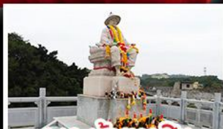
พระเจ้าตากสิน