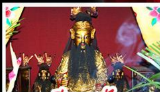
เซียงบูชัว