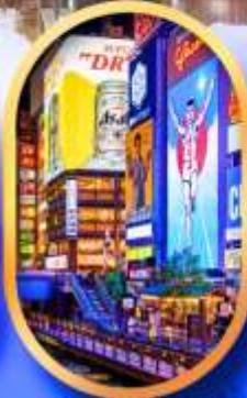
ย่านชิบะฮาชิจิ