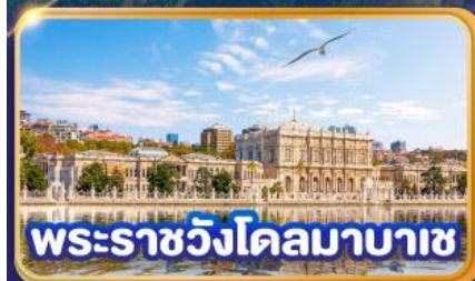
พระราชวังโดลมาบาซ