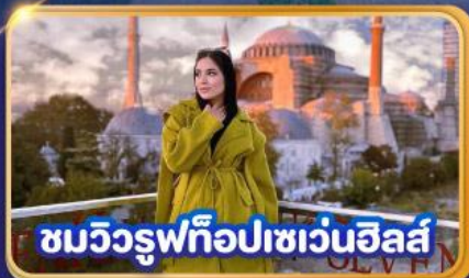
ชมวิวยุโรปเซเวนฮิลส์