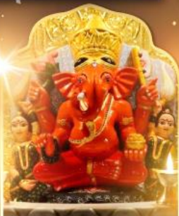
องค์สิทธีวินายก