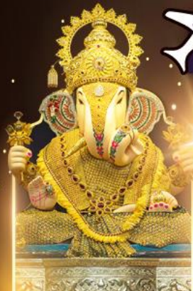
องค์ดีกษุท์เศษฐ์