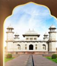
ทัชมาฮาลน้อย