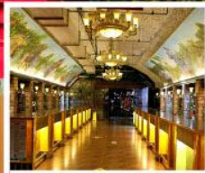
พิพิธภัณฑ์ไวน์ชิงเต่า