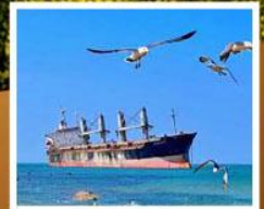
เรือสินค้าเกย์ตันบลูอิส