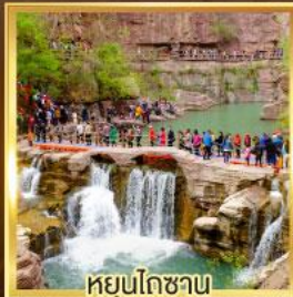
หยุ่นโกซาน