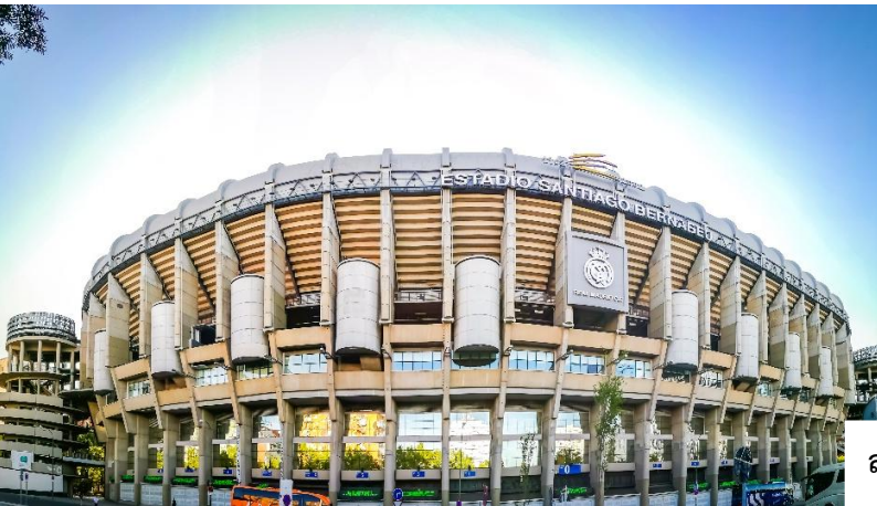
สนามฟุตบอล ซานเตียโก เบร์นาเบว (Estadio Santiago Bernabéu)

ชมด้านหน้า สนามฟุตบอล ซานเตียโก เบร์นาเบว (Estadio Santiago Bernabéu) คือสนามเหย้าของทีม รีล มาดริด (Real Madrid) หนึ่งในสโมสรฟุตบอลที่ยิ่งใหญ่และประสบความสำเร็จที่สุดในโลก ตั้งอยู่ในใจกลางกรุง มาดริด ประเทศสเปน