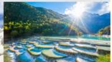
ทะเลสาบไป๋สุ่ยเหอ

*ทางบริษัทฯ ขอสงวนสิทธิ์ในการสลับโปรแกรมทัวร์ตามความเหมาะสมขึ้นอยู่กับสถานการณ์ปัจจุบัน โดยคำนึงถึงผลประโยชน์ของลูกค้าเป็นสำคัญ