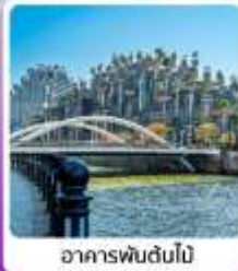
อาคารพันดับไม้