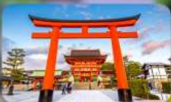
ศาลเจ้าฟูชิมิ