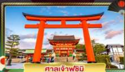
ศาลเจ้าฟุชิมิ