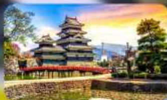
ปราสาทมิดสึโมโด้