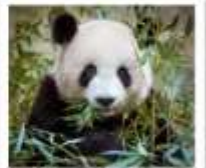
ศูนย์อนุรักษ์หมีแพนด้าจู่เจียงเยียน