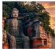
ทิวทัศน์เสื่อซาน