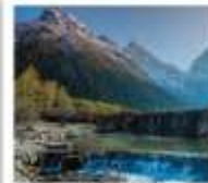
อุทยานปี้เฉิงโกว