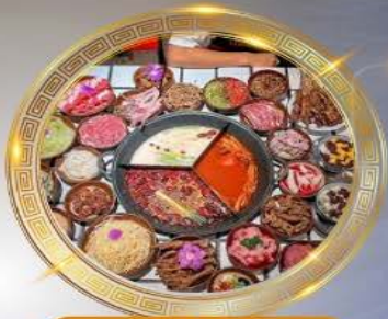
บุฟเฟ่ต์มือโหลงซิ่ง