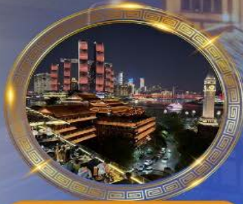
มือคำร้านอาหารวิวหลักลัน