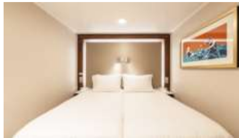
พัก 1-2 ท่าน

From 13 - 14 sq.m Max Occupancy 2-4 ^ Deck 5/8/9/10/11/12/13/15 2 Single Beds / 2 Single Beds + 1 Ceiling Pullman Bed / 1 Single Bed + 1 Pullman Bed + 1 Double Sofa Bed