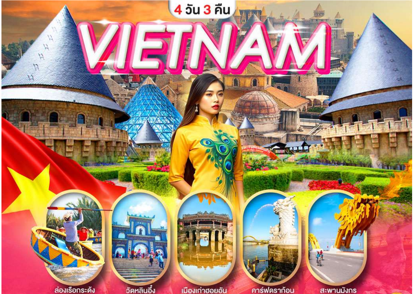
ล่องเรือกระดังง์