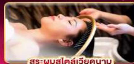
สระผมสไตล์เวียดนาม