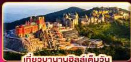
เที่ยวบานาฮิลล์เต็มวัน

ล่องกระทงขามดำคืนที่ฮอยอัน ไฟล์ทสวย บินเช้า-กลับเย็น