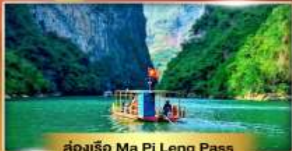
ส่องเรือ Ma Pi Leng Pass

เส้นทางเปิดใหม่ ซาฮาง เช็คอินเมืองตามด้าว "เวียดนามฟีลยูโรป"