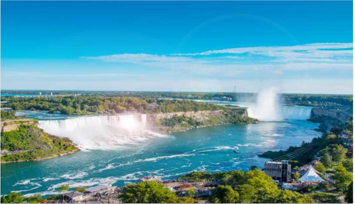
NIAGARA FALLS STATE PARK

นำท่านเดินทางสู่ “อุทยานแห่งชาติไนแอกการ่า” (Niagara Falls State Park) ฝั่งสหรัฐอเมริกา หนึ่งในสิ่งมหัศจรรย์ทางธรรมชาติของโลก ที่ได้รับการยกย่องให้เป็นสถานที่ท่องเที่ยวยอดนิยม และเป็น หนึ่งในสามจุดหมายปลายทางสุดโรแมนติกสำหรับการดื่มด่ำผิงพระจันทร์ของคู่บ่าวสาวชาวอเมริกัน น้ำตกไนแอก