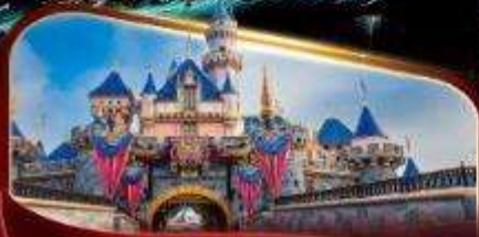
ดิสนีย์แลนด์พาร์ค