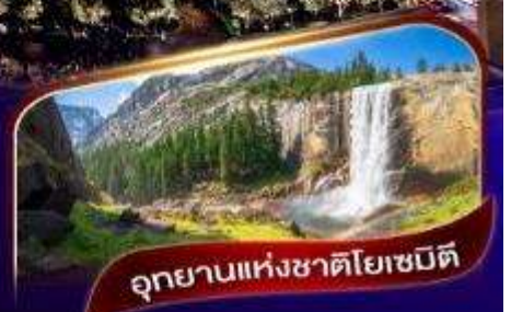
อุทยานแห่งชาติโยเซมิตี