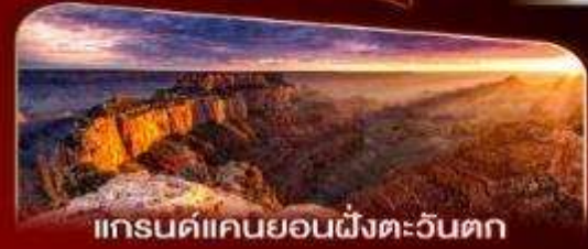
แกรนด์แคนยอนฝั่งตะวันตก

พักลาสเวกัส 2 คืน เต็มอิ่มกับแสงสีแห่งอเมริกา