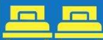
ห้องพักเตียงคู่ TWIN