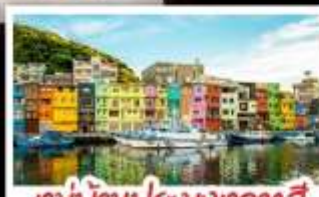
หมู่บ้านประมงหลากสี