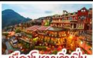
เมืองโบราณจิวเฟิ่น

ฟาร์มแกะชิงจิ้ง - ทะเลสาบสวี่นจินตรา จิวเฟิ่น - หมู่บ้านประมงหลากสี - ไทเป 101 หมู่บ้านสายรุ้ง - ตลาดล่าหู่ & ซีเหมินติง ปลาประ-ธานธิบดี - เขียวหลงเป่า