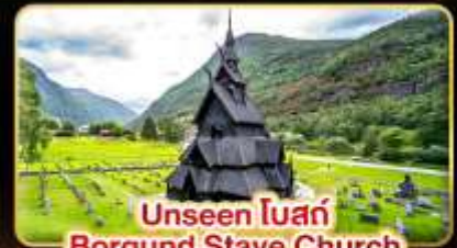
Unseen โบสถ์ Borgund Stave Church