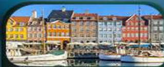
ย่านนูฮาวน์