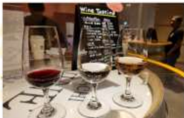
IKEDA WINE CASTLE