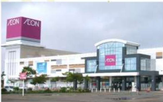
SHOPPING AT AEON MALL KUSHIRO SHOWA