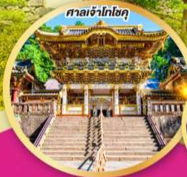
ศาลเจ้าโทโฮคุ