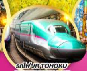
รถไฟ JR TOHOKU SHINKANSEN LINE