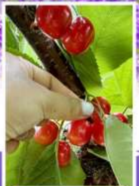
กิจกรรมเก็บเชอร์รี่

🚿 ออนเซ็น 2 คืน 🧳 นน.กระบี่ 23 กก. 1 ใบ ☀️ 6Days 4Night