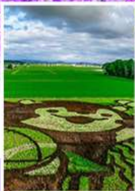
ศิลปะบนทุ่งข้าว